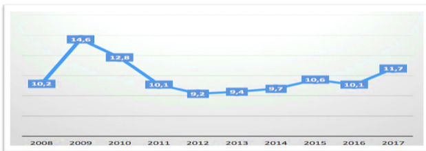
Grafik 2: İşsizlik Oranları (Mart 2008-Mart 2017)

2008 yılında uluslararası düzeyde yaşanan krizle birlikte diğer birçok ülke gibi işsizliği azaltıp istihdamın artırılması vaadiyle krize karşı emek piyasasını esnekletirecek kısa vadeli programlar uygulanmaya konulmuştur. ILO’nun 2012 Dünya Çalışma Raporu’na göre, 2008 krizi sonrasında 50 milyon kişi işini kaybederken en fazla ileri kapitalist ülkelerde istihdam kaybı yaşanmıştır. Genç işsizliğin oranında %80’lik bir artış gerçekleşirken, krizle birlikte işsiz kalanların %36’sı bir yıldan fazla süredir iş aramaktadır. 2008 krizi dünyada egemenlik altındaki yarı sanayileşmiş ülkelerde üçte bir oranında, ileri kapitalist ülkelerde ise egemenlik altındaki yarı sanayileşmiş ülkelere göre bir buçuk katı yoksulluk oranı artmıştır (Müftüoğlu, 2003).